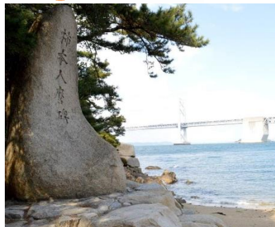
沙弥島・柿本人麻呂歌碑