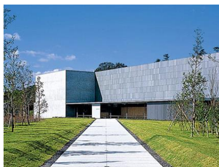
東山魁夷せとうち美術館